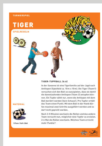
BEISPIEL EINES MANNSCHAFTS- SPIELS FÜR DAS SPIELTURNIER