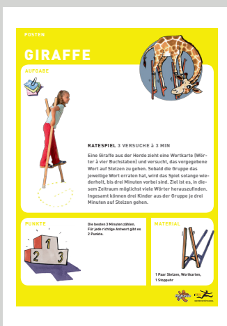
BEISPIEL EINER POSTENAUFGABE